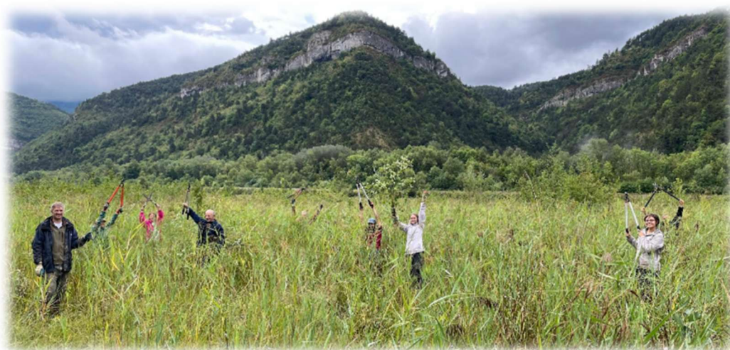
Coupe de ligneux