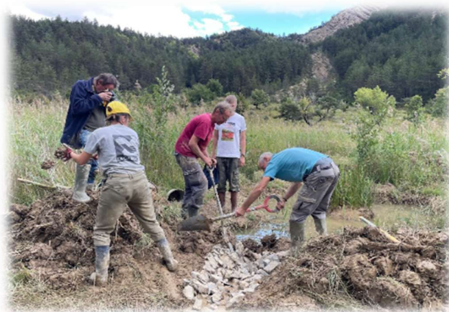
Agrandissement de la mare