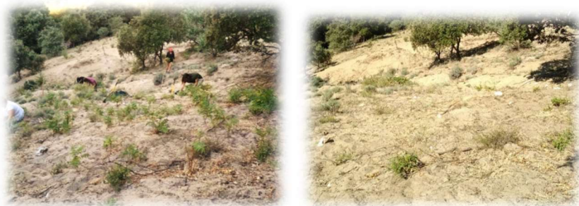
En cours d'arrachage...